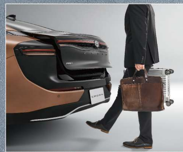
足踢感應式電動尾門(皇家版)