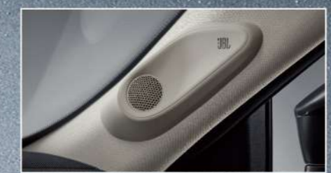
JBL Premium Sound音響(皇家版)

微包覆座椅舒適透氣，將膝部空間放到最大，讓每位乘員皆享頭等艙的寬敞享受，暖金色滾邊與精緻縫線相輝映，移動間盡享華貴。