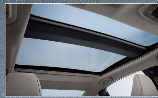
全景式天窗(皇家版)