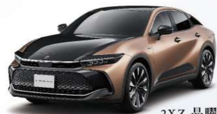
2XZ 晶曜銅 / 雙色