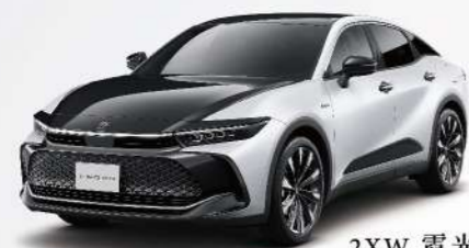
2XW 霓光白 / 雙色