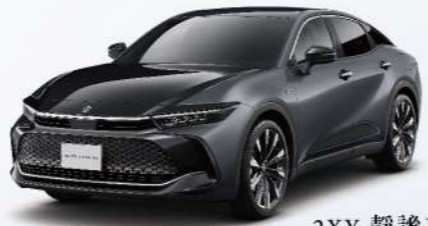
2XY 靜謐灰 / 雙色