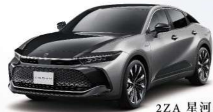
2ZA 星河鈦 / 雙色