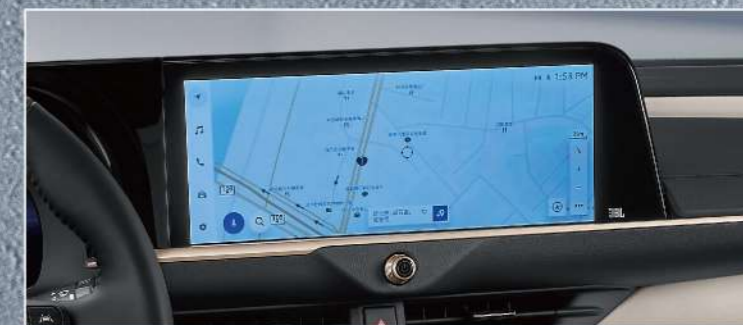
12.3吋多功能導航主機附智慧手機連結