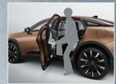
最適車高 上下車優雅便利