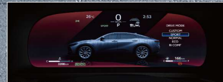
5種駕駛模式(皇家版)