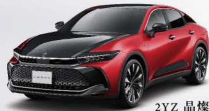
2YZ 晶燦紅 / 雙色