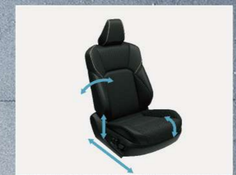
雙前座八向電動調整加熱通風座椅(皇家版)