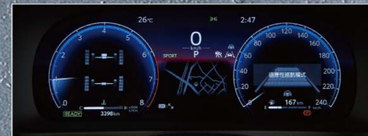
12.3吋全彩數位式儀錶板