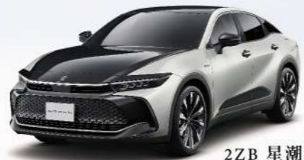
2ZB 星潮銀 / 雙色