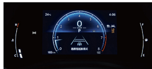
7吋全彩式數位儀錶板 (HYBRID尊爵、汽油豪華)