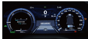
12.3吋全彩式數位儀錶板 (HYBRID旗艦、汽油旗艦)