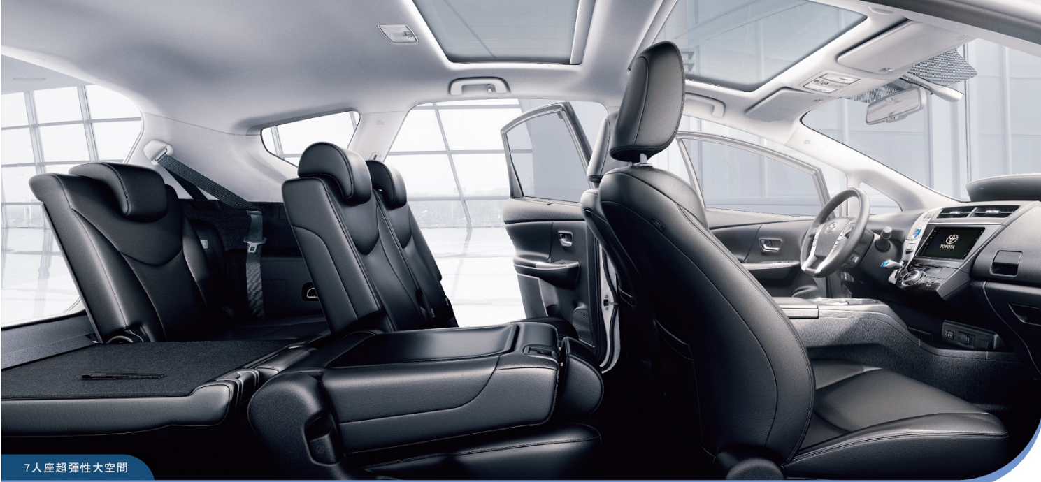
7人座超彈性大空間