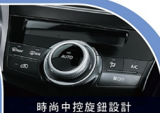
時尚中控旋鈕設計