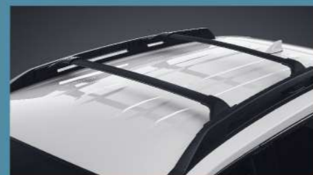
■ 運動車頂架附鋁合金置物橫桿