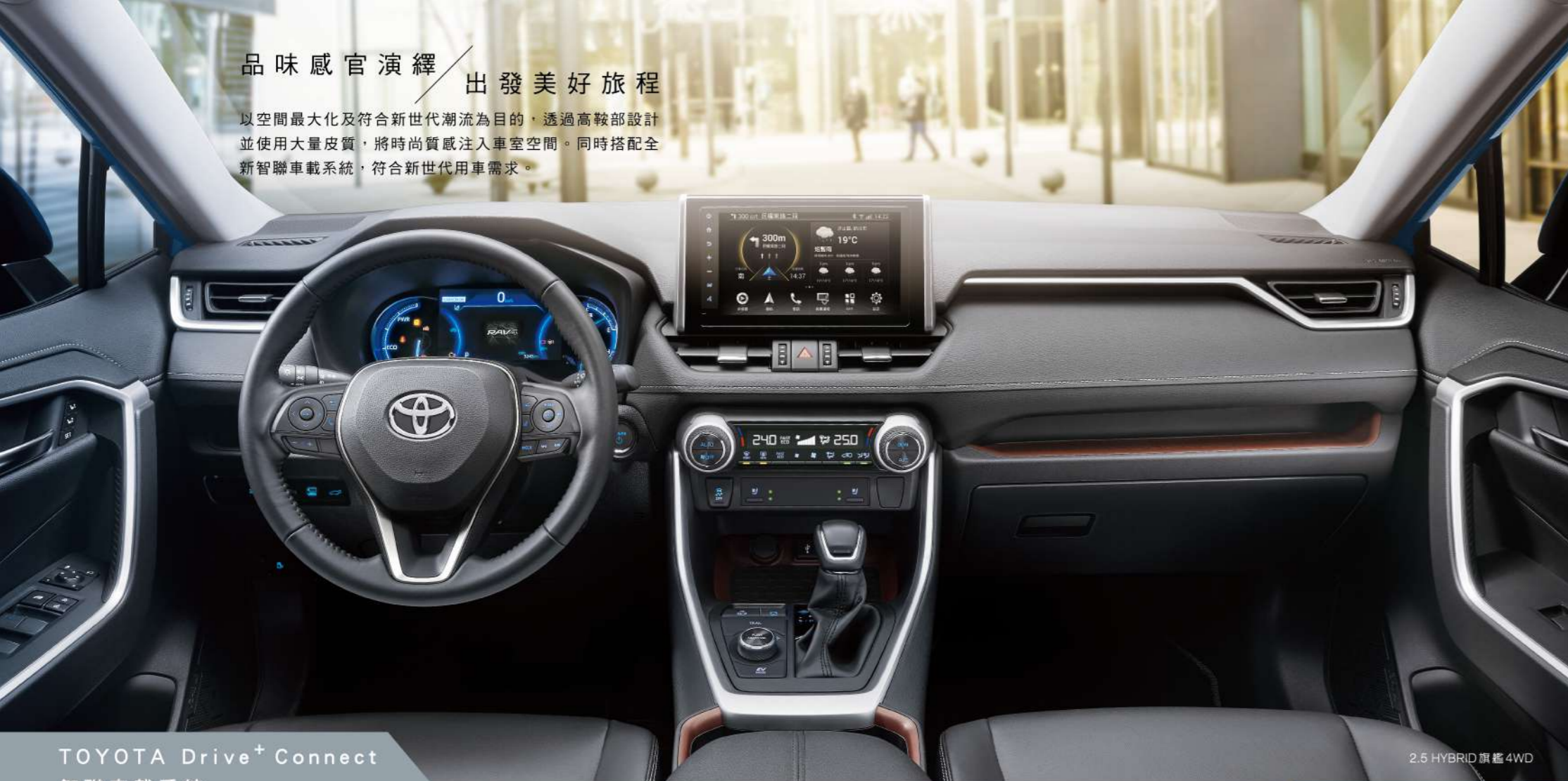
TOYOTA Drive+ Connect 智聯車載系統

以空間最大化及符合新世代潮流為目的，透過高鞍部設計並使用大量皮質，將時尚質感注入車室空間。同時搭配全新智聯車載系統，符合新世代用車需求。