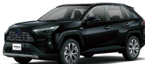
◎* 尊爵黑 218