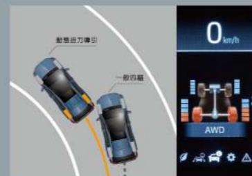
■ Dynamic Torque Vectoring System 動態扭力導引系統