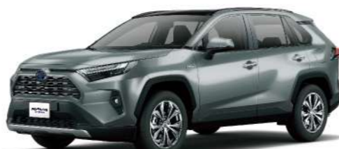
* 月岩綠 6X3