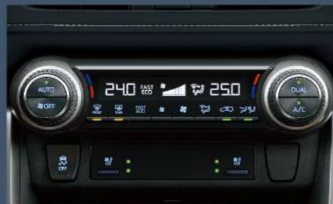
■ S-Flow智慧型雙區恆溫控制空調系統 (2.0尊爵以上)