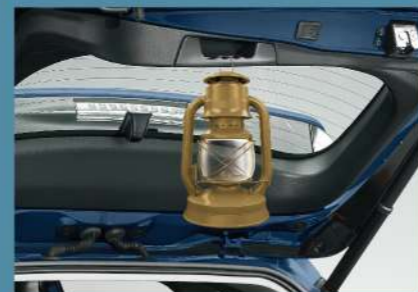
■ 多功能尾門握把/掛勾