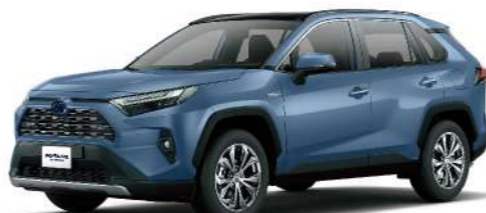
* 石漠藍 8W2