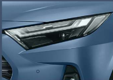
■ LED Bi-Beam頭燈組 (HYBRID車型)