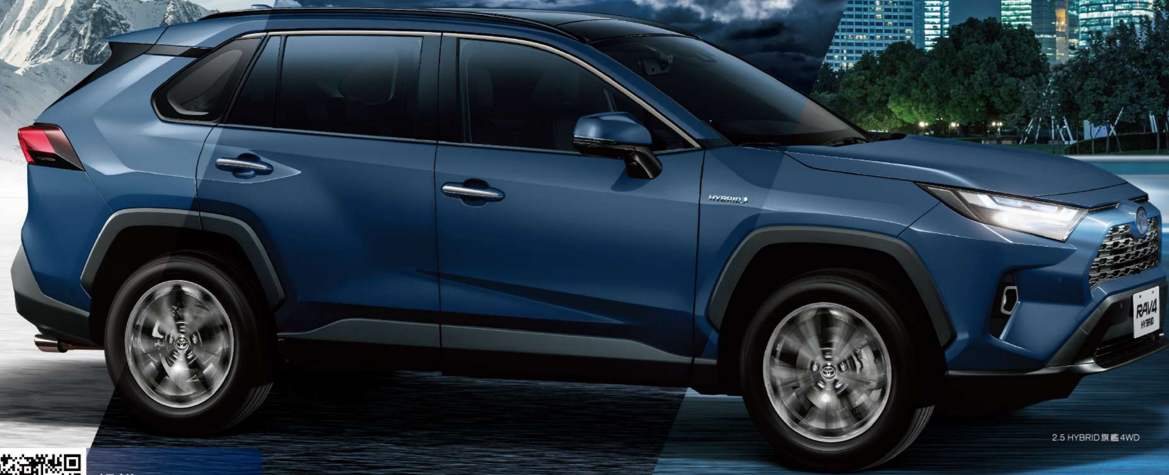
2.5 HYBRID 旗艦4WD