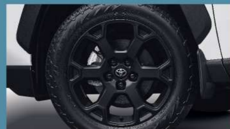
■ 18吋運動化消光黑鋁圈 搭配全地形輪胎