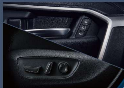
■ 電動座椅附記憶功能 (2.0尊爵、2.0旗艦、2.5 HYBRID旗艦以上)