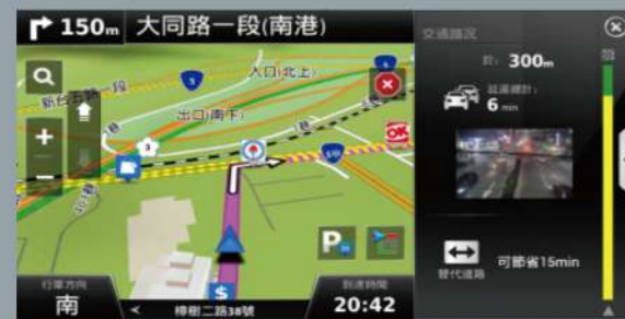
■ 智慧導航 即時路況