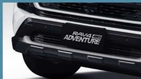
■ 前保險桿下護板專屬塗裝