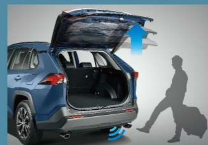
■ 足踢感應式電動尾門(2.0 旗艦以上)