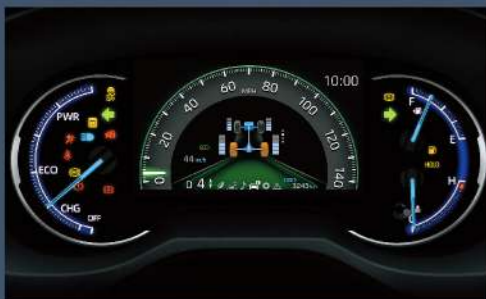
■ 7吋全彩MID TFT多功能資訊顯示幕 (2.0尊爵以上、2.5 HYBRID尊爵除外)