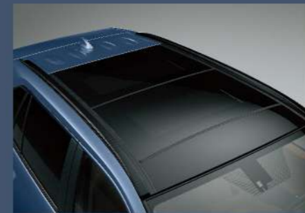
■ 全景式電動天窗 (2.0 ADVENTURE 4WD、2.5 HYBRID旗艦 4WD)