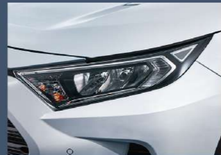
■ LED反射式頭燈組 (汽油車型)