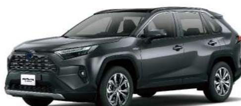
◎* 雲河灰 1G3