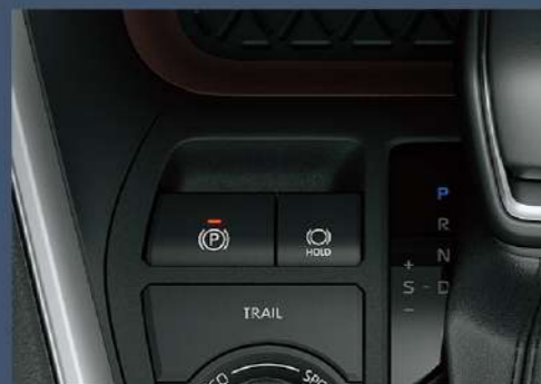
■ EPB電子駐車煞車系統 (附Auto Hold功能)