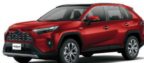
* 躍動紅 3T3