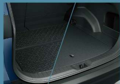
■ 雙面使用行李廂底板