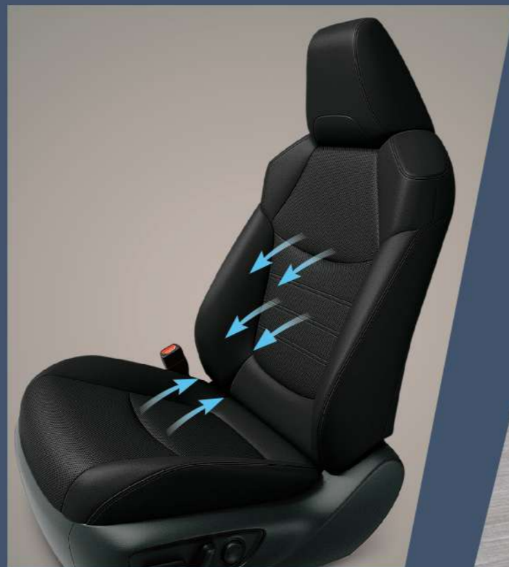
■ 雙前座通風座椅 (2.5 HYBRID旗艦以上)