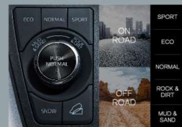
■ AWD Integrated Management(AIM) 智慧型四驅整合系統

*腳踏車及其固定架為示意圖，非實車標準配備，依車頂裝載物品不同，所需專用固定夾具亦有差異。