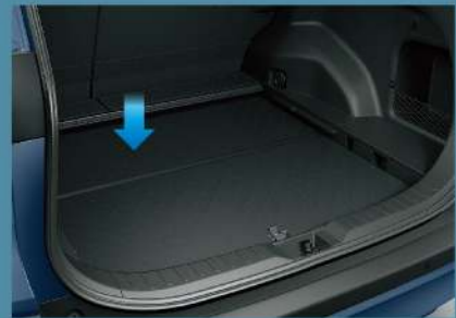
■ 上下可調式行李廂底板