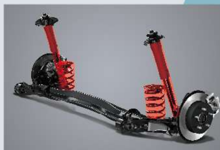
GR SPORT 運動化懸吊