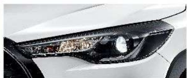
Bi-Beam 頭燈組(鹵素) (汽油豪華、HYBRID 豪華、GR SPORT)