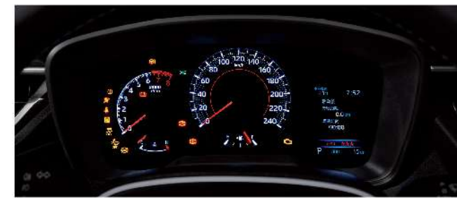
雙環式儀錶板附4.2吋MID (汽油安心、豪華、GR SPORT)