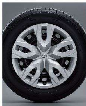
17吋高強度鋼圈(安心)