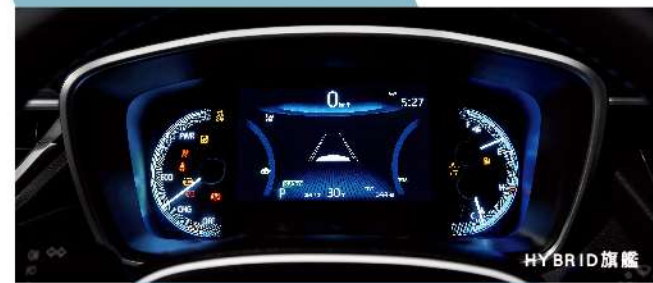
數位式儀錶板附7吋MID (汽油尊爵以上、HYBRID GR SPORT)