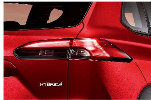
LED 光條式尾燈 (汽油尊爵、HYBRID尊爵、HYBRID旗艦)