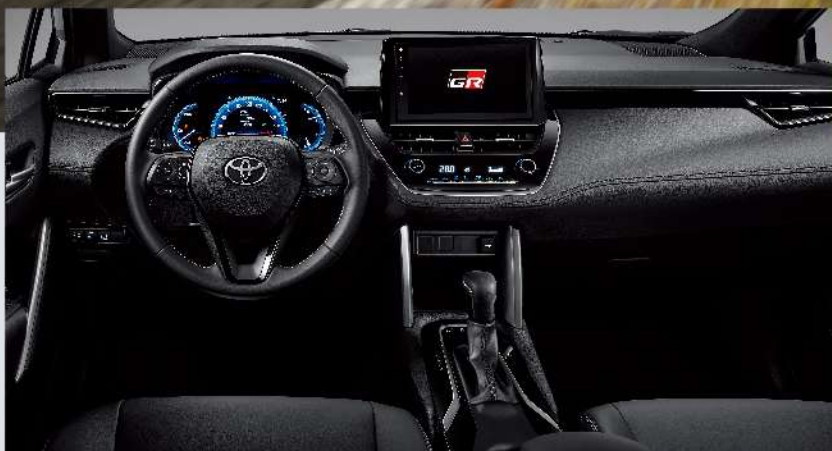
GR SPORT 專屬勁黑質感內裝