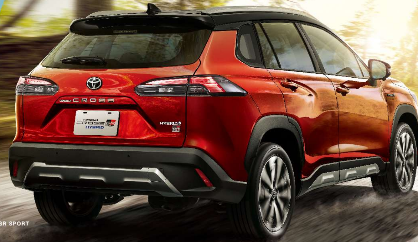
HYBRID GR SPORT

GR SPORT專屬前衛設計 以燻黑LED光條式尾燈 與18吋雙色切削鋁圈 展現熱血跑格，釋放不羈靈魂