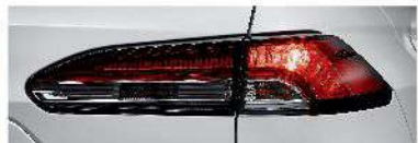
LED 尾燈組 (安心、汽油豪華、HYBRID 豪華)