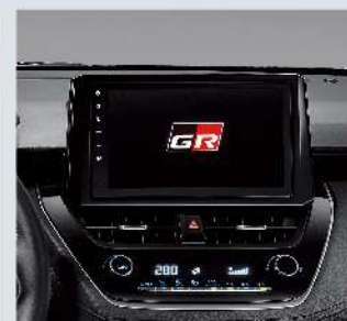
9吋WiFi主機附GR開機畫面