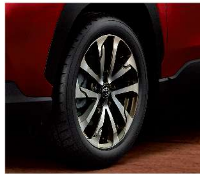
18吋雙色切削鋁圈 (HYBRID旗艦、GR SPORT車型)