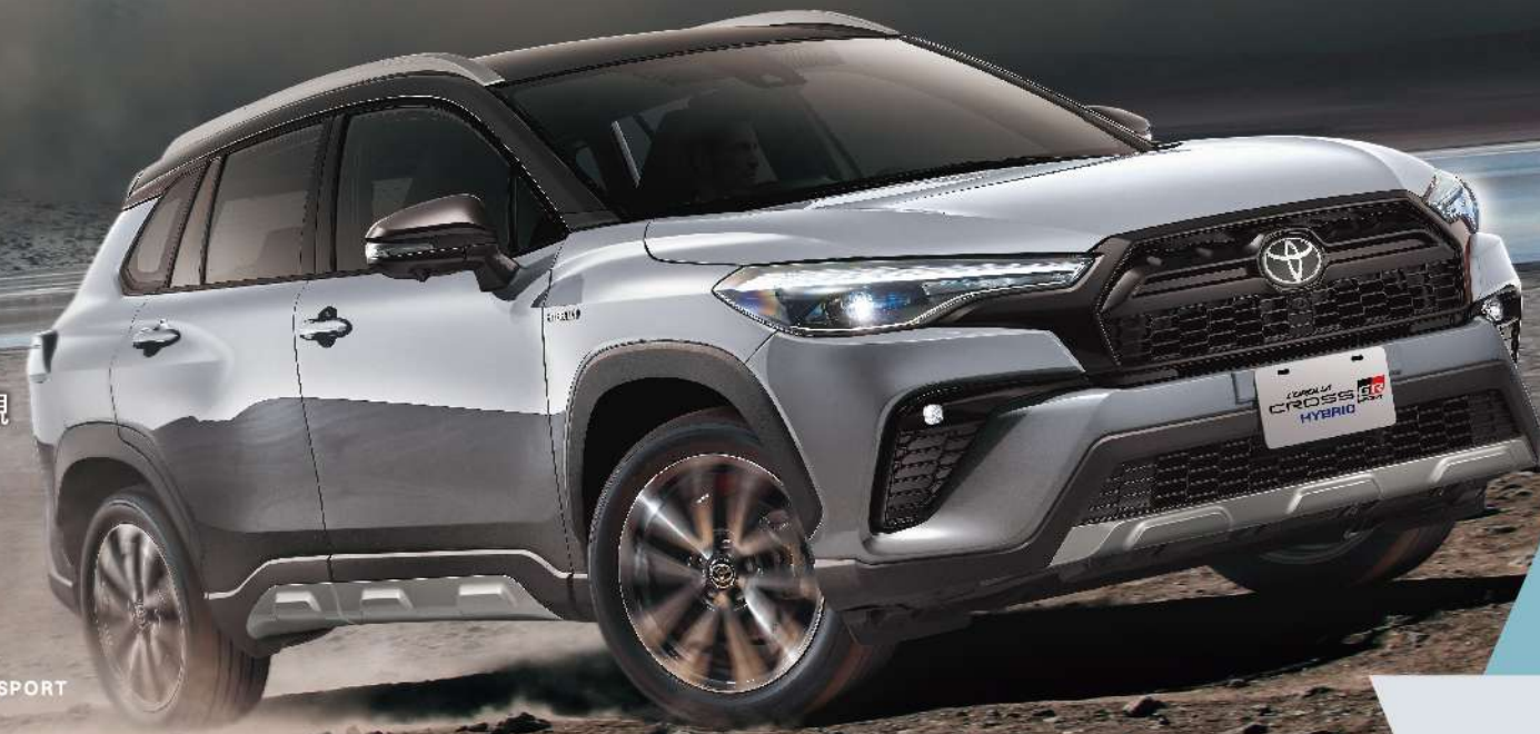
HYBRID GR SPORT

COROLLA CROSS GR SPORT 強悍敏捷的操控性能 加上引領潮流的霸氣運動化外觀 讓每次奔馳，更率性狂放！