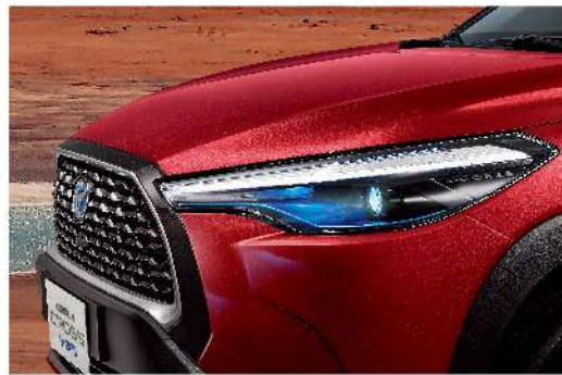
LED Bi-Beam 投射式頭燈 (汽油尊爵、HYBRID尊爵、HYBRID旗艦、HYBRID GR SPORT)*灌壓式燈殼為一般HYBRID車型專屬