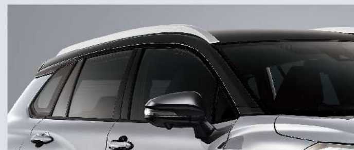
潮炫雙色車頂設計

GR SPORT專屬前衛設計 以燻黑LED光條式尾燈 與18吋雙色切削鋁圈 展現熱血跑格，釋放不羈靈魂