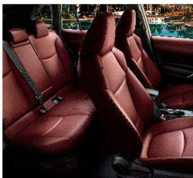
紅色內裝(豪華以上)