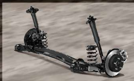
全新 TNGA 扭力桿式後懸吊

全新TNGA扭力桿式後懸吊，採用高剛性扭力桿支臂，搭配防傾平衡桿，提供優異操控表現。完美的懸吊幾何設定、新設計懸吊支架與大型襯套，能降低路面傳導至車體的衝擊力道，提供更平穩舒適的行車質感。