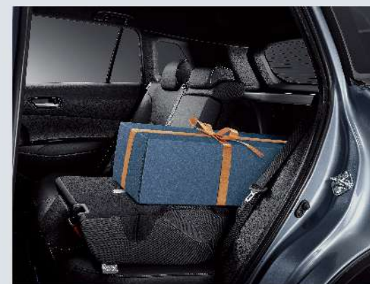
後座椅 6/4 分離椅背收折