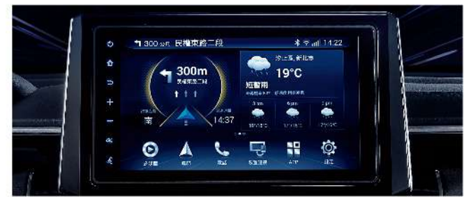
TOYOTA Drive+ Connet 智聯車載系統 4G旗艦版四大核心功能(TOYOTA正廠選配用品)：智慧導航、24H愛車守護、旅程日誌、一鍵救援，並支援 Apple CarPlay™ 與 Android Auto™。

*Drive+ Connet 智聯車載系統之作動皆有其限制條件，詳情請參閱使用手冊或官網相關QA說明。