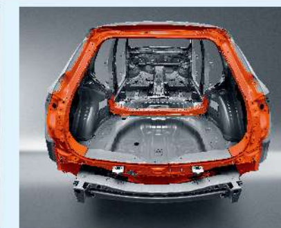
雙環狀車體結構設計