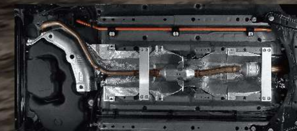
底盤雙鋁合金剛性強化支架

於底盤中央通道採用鋁合金剛性強化支架，有效強化車身剛性，提供車主更多操駕樂趣。* GR SPORT 車型除外