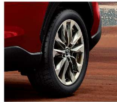
17吋十幅式鋁圈 (汽油豪華以上)