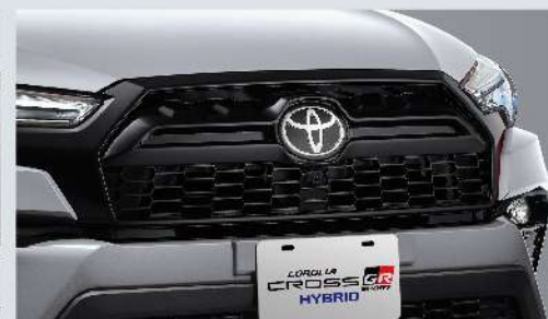
蜂巢式燻黑水箱護罩