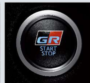
引擎啟閉按鈕附GR字樣