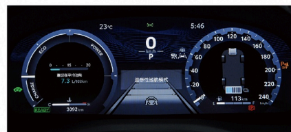
12.3吋全彩式數位儀錶板 (HYBRID旗艦、汽油旗艦)