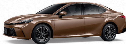
4Y6 / 晶曜銅