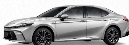
1F7 / 極光銀