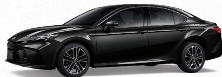
218 / 尊爵黑