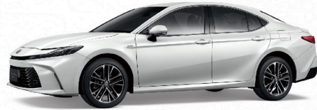
089 / 鉑鑽白