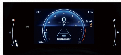
7吋全彩式數位儀錶板 (HYBRID尊爵、汽油豪華)