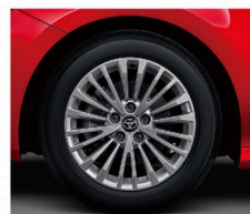
17吋銀色多幅式鋁圈 (HYBRID尊爵、汽油豪華)