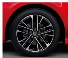
18吋雙色切削鋁圈 (HYBRID旗艦、汽油旗艦)