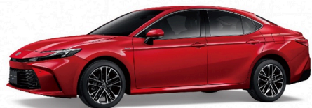
3U9 / 極羨紅