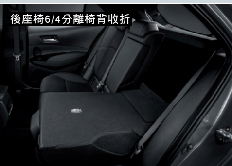
後座椅6/4分離椅背收折