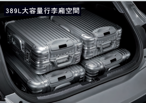
389L大容量行李廂空間