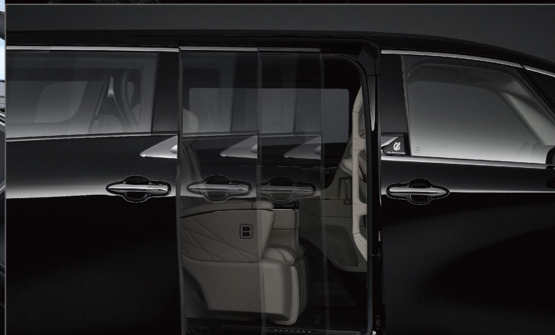
左右兩側電動滑門

頂規舒適後座，中央走道便利設計，配備四區獨立恆溫空調，以私人機艙理念打造尊榮享受，品味無可妥協，尊榮不可言喻。