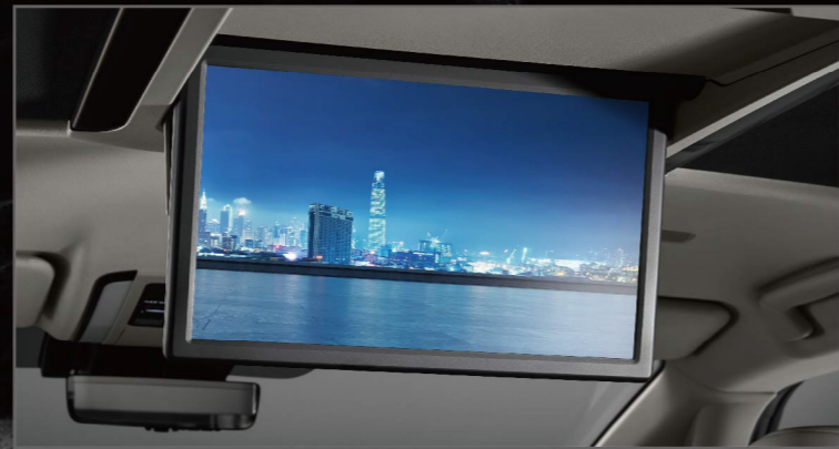
後座專屬14吋影音系統