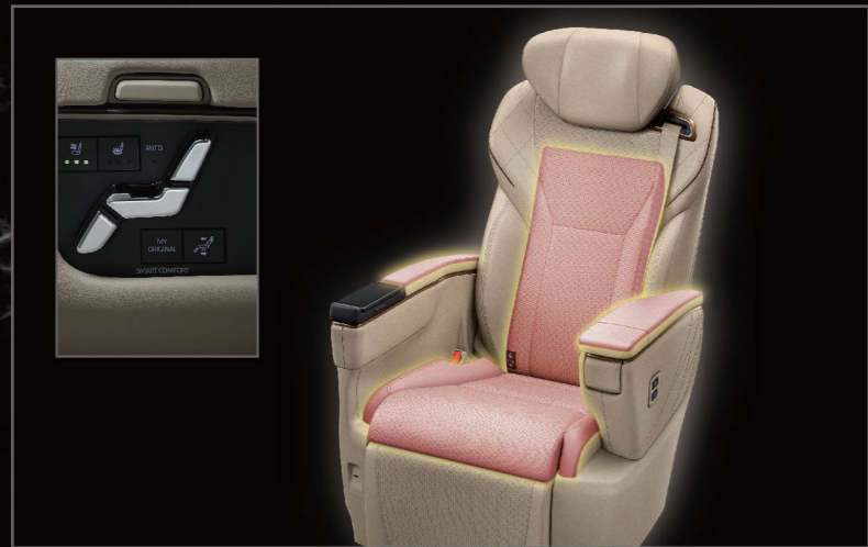
直覺式立體電動座椅調整鈕 (可調整座椅高低、椅背傾角與腳靠)