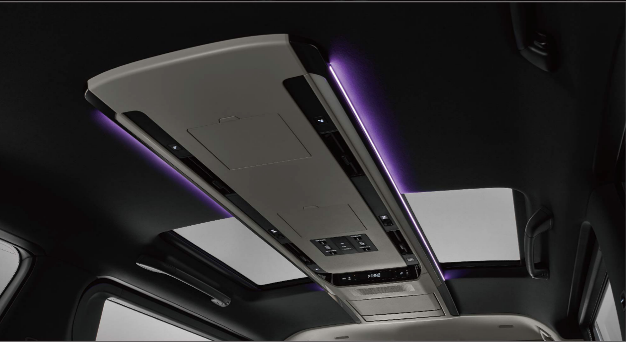
左右獨立式全景天窗