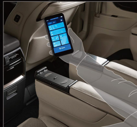
第二排專屬無線觸控面板 (可調整座椅/燈光/遮陽簾/影音系統)