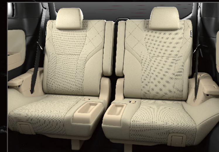
第三排獨立雙座設計 (PHEV專屬)