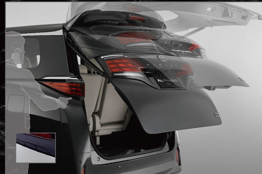
車側啟閉式電動尾門