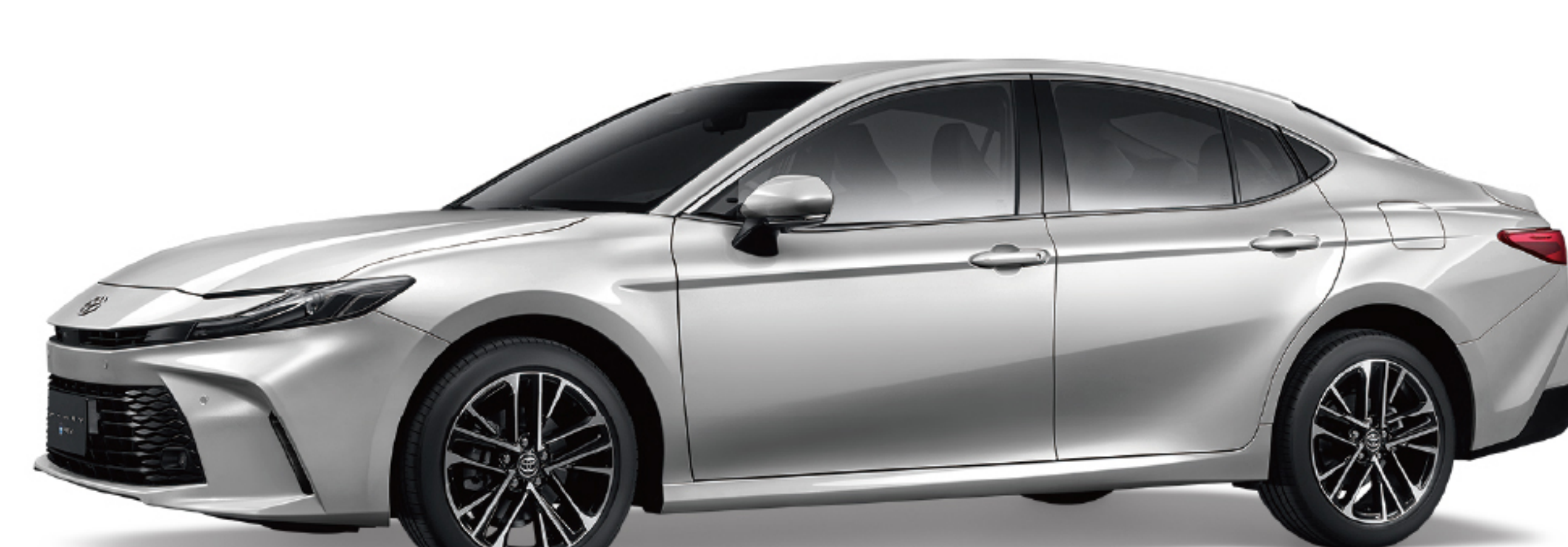
1F7 / 極光銀