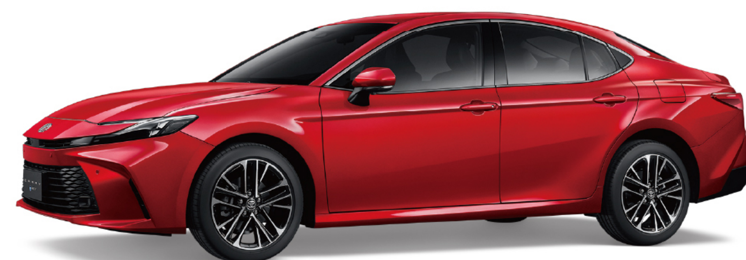
3U9 / 極羨紅