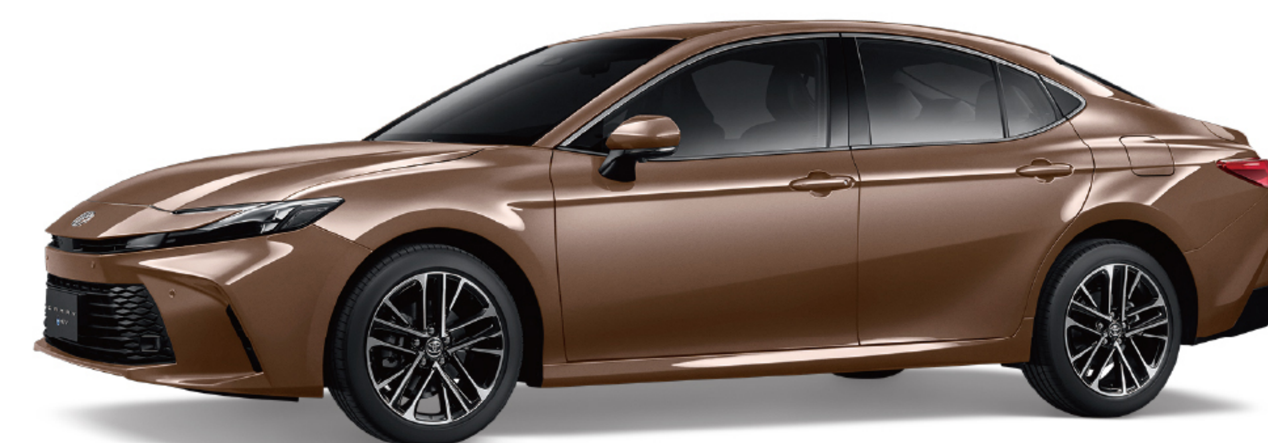
4Y6 / 晶曜銅