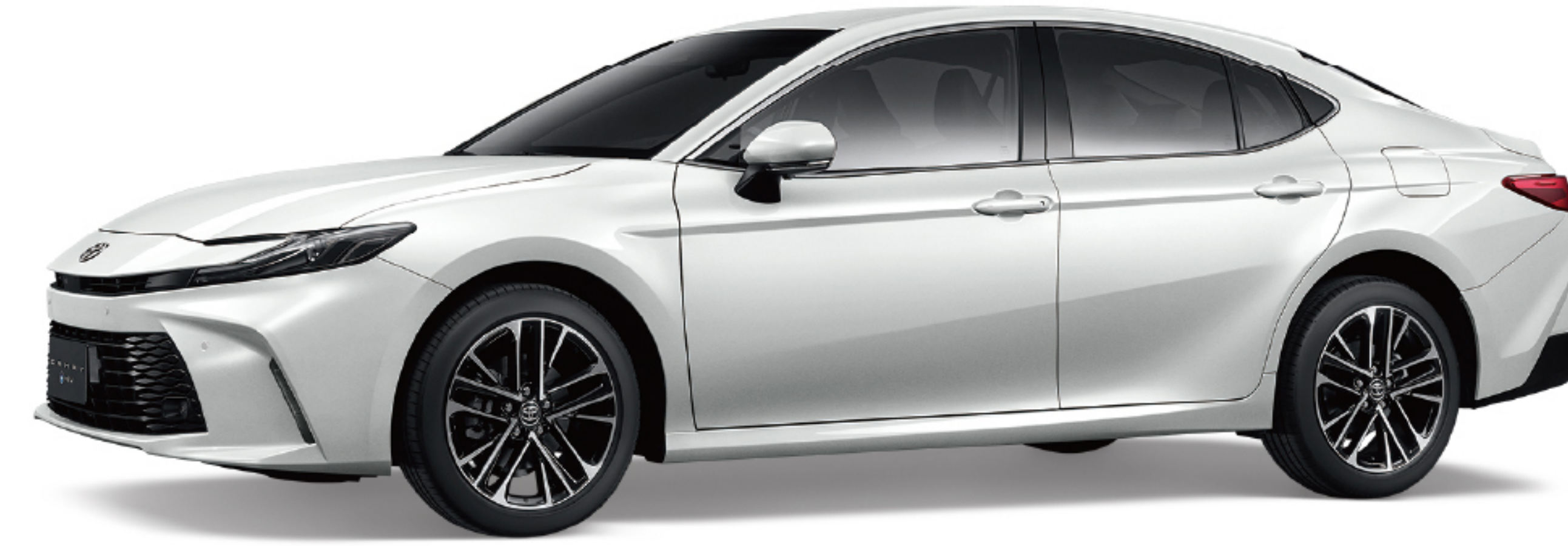
089 / 鉑鑽白