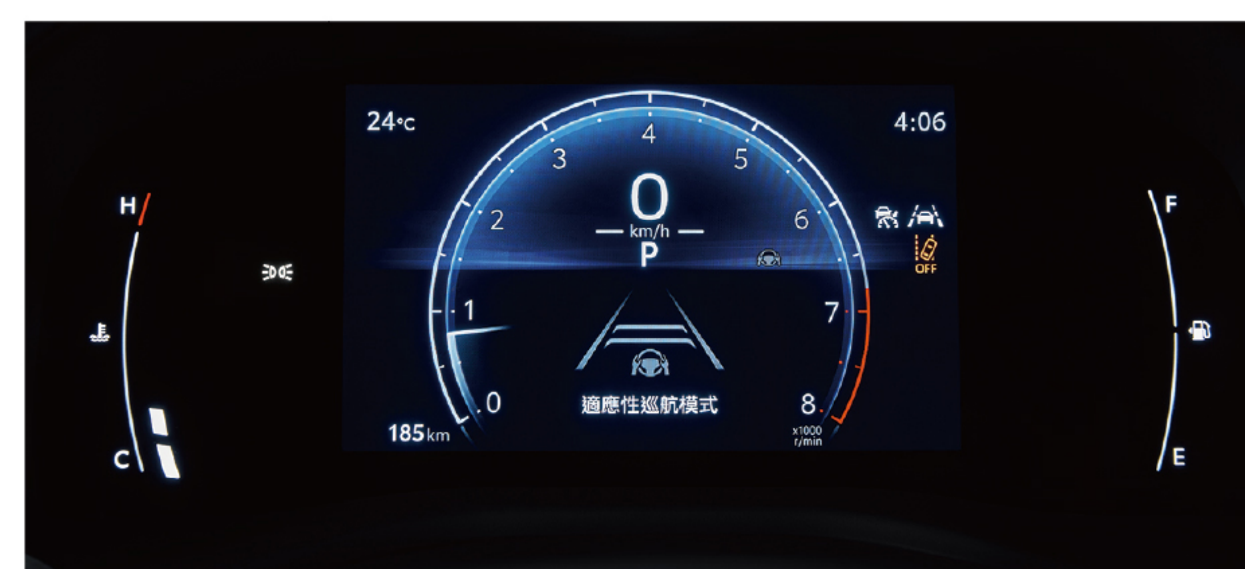
7吋全彩式數位儀錶板 (HYBRID尊爵)