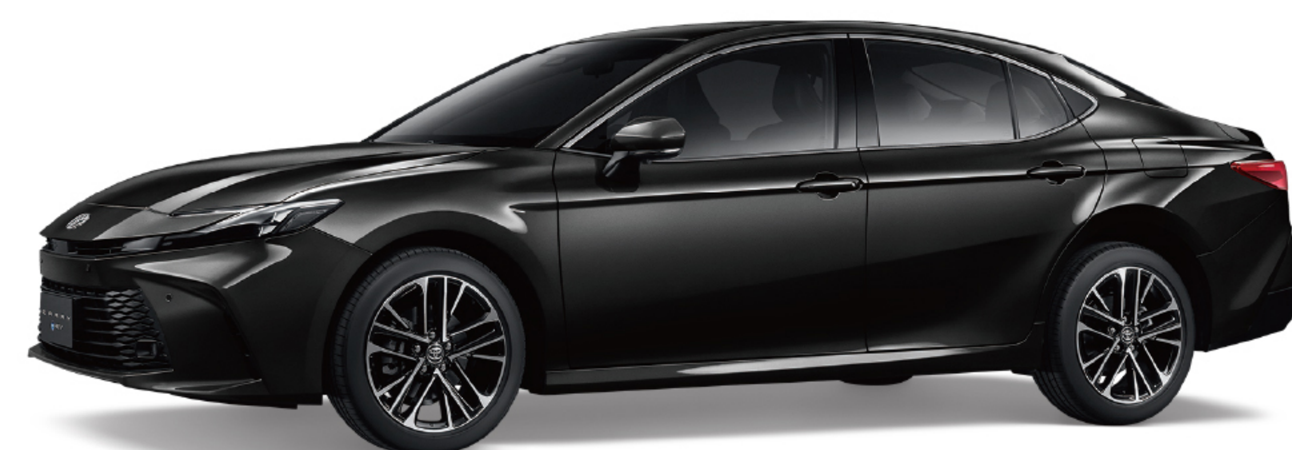
229 / 深邃黑