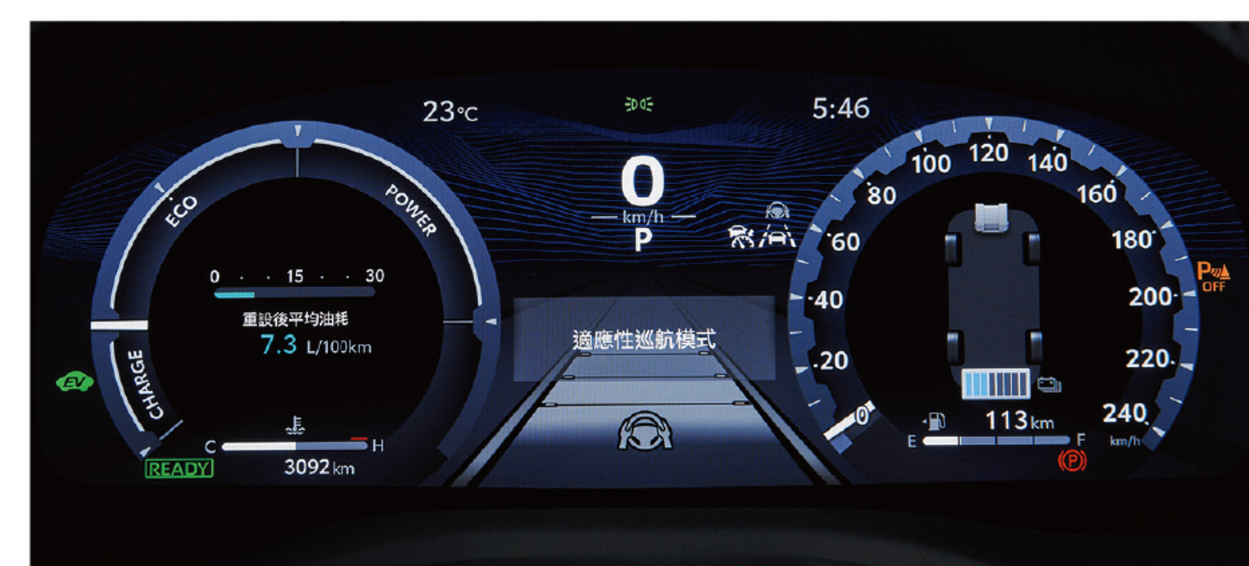
12.3吋全彩式數位儀錶板 (HYBRID旗艦、汽油旗艦)