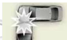
衝撞乘車空間以外的側面